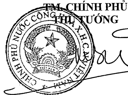
Phạm Minh Chính